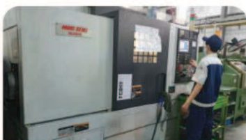
CNC旋盤 - Mori Seiki モデル: NL2500