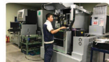
ワイヤーカット加工機 モデル: Sodick VL400Q