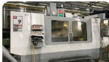
立形マシニングセンター モデル: HASS VF-9