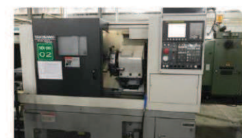
CNC旋盤 モデル: Takisawa TCN-2100 L6