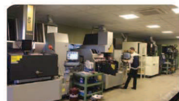
放電加工機 モデル: Sodick AD35L, AD3L