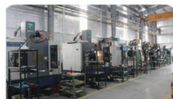
立形マシニングセンター モデル: Mori Seiki