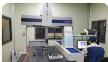
三次元測定(CMM) - Tokyo Seimitsu モデル: XYZAX SVA NEX9/10/6-C6