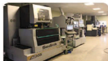
ワイヤーカット加工機 モデル: Sodick AQ600L