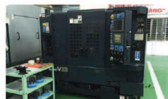
立形マシニングセンター モデル: Makino V33