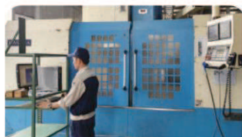
立形マシニングセンター モデル: KASUGA KV1400