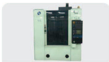
立形マシニングセンター モデル: Makino E33