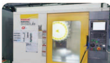
ロボドリル モデル: α-D21LiB