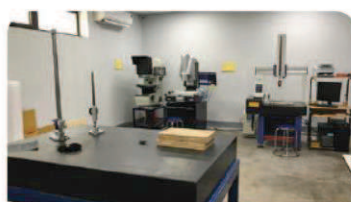
三次元測定 モデル: Mitutoyo M443