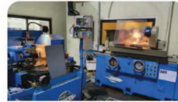
円筒研磨機 - JAGURA モデル: JAG-CG3260-AL