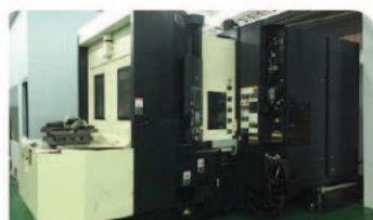
横型マシニングセンター モデル: Makino A77