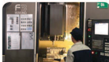
立形マシニングセンター モデル: Makino F3