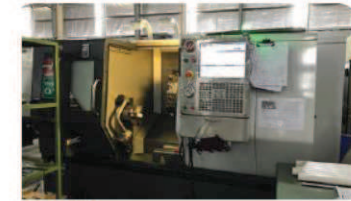
CNC旋盤 モデル: HASS ST-20